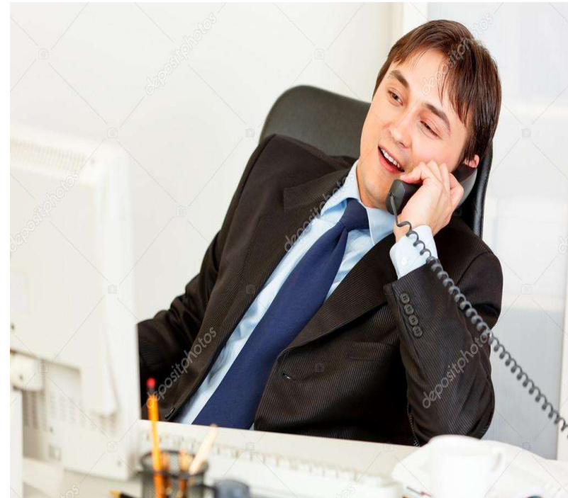
CASO DE LA LLAMADA TELÉFONICA