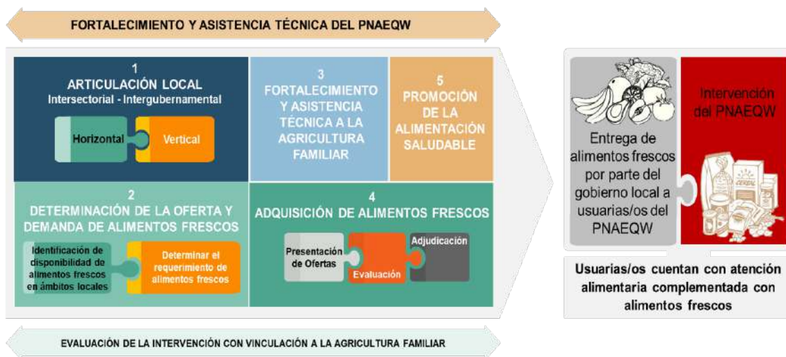
GRÁFICO N° 1: MODELO OPERACIONAL

A continuación, en el Grafico N° 01 se visualiza el Modelo Operacional, incluida sus cinco fases que se detallan en el numeral 8.2 del presente documento.