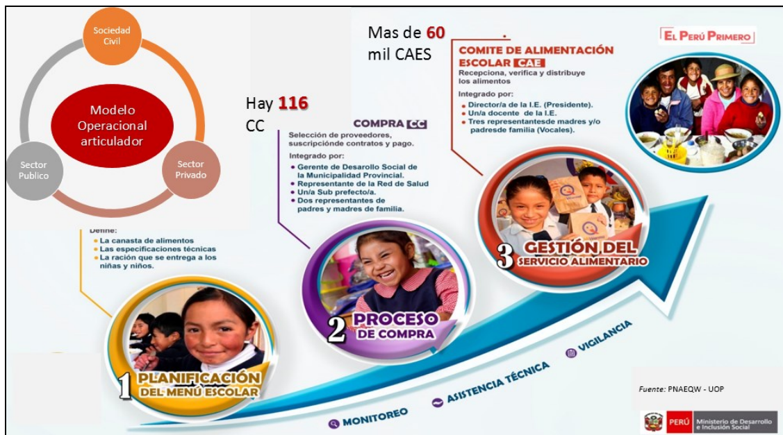
Figura N° 01 Modelo Operacional del PNAEQW

El “Plan Anual de fortalecimiento de capacidades a los actores vinculados a la prestación del servicio alimentario del Programa Nacional de Alimentación Escolar Qali Warma (PNAEQW) 2020”, tiene como finalidad fortalecer las capacidades de los actores vinculados a la prestación del servicio alimentario como son los integrantes de los Comités de Compra (CC), Comités de Alimentación Escolar (CAE) y actores vinculados a la prestación del servicio alimentario, para la mejora de la gestión del servicio alimentario que brinda el programa y en la promoción de los hábitos saludables en las niñas y niños de las instituciones educativas (IIEE) públicas de Educación Básica Regular, de Jornada Escolar Completa (JEC) y Formas de Atención Diversificada (FAD), desarrollada a través de la metodología educativa en cascada, donde participa los equipos técnicos de las Unidades Territoriales 3 ; utilizando las Tecnologías de la Información y la Comunicación (TIC) para las estrategias de capacitación y asistencia técnica.