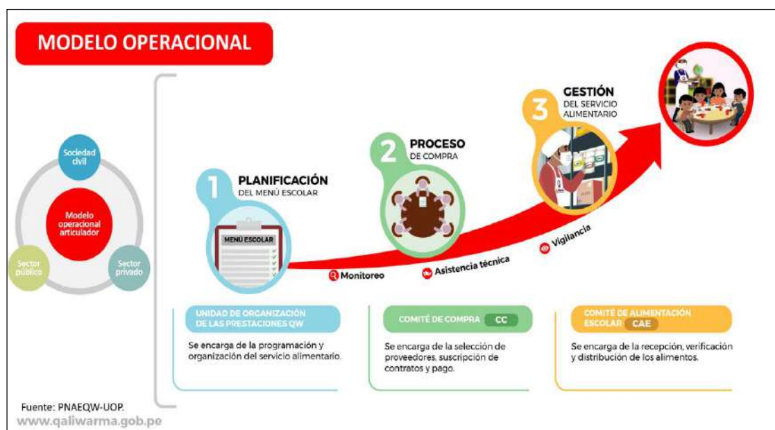
Figura N° 01 Modelo Operacional del PNAEQW

El Programa Nacional de Alimentación Escolar Qali Warma (PNAEQW) opera mediante el modelo de cogestión, que incluye tres fases: i) planificación del menú escolar, ii) fase de compra y ejecución contractual 1 , y iii) gestión de la prestación del servicio alimentario. En todo este proceso participan los Comités de Compra (CC), Comités de Alimentación Escolar (CAE) y actores vinculados a la prestación del servicio alimentario 2 .