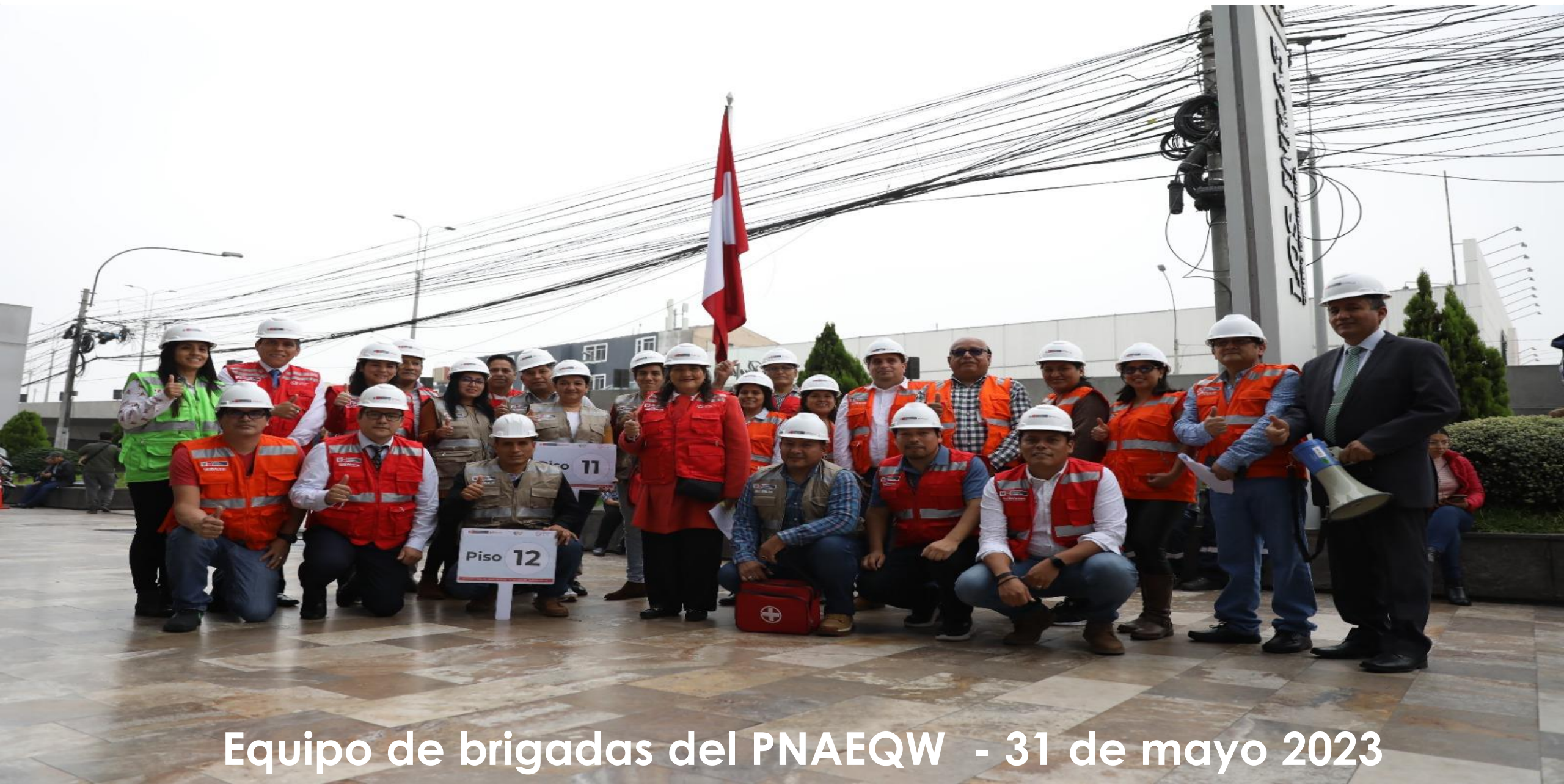
Equipo de brigadas del PNAEQW - 31 de mayo 2023