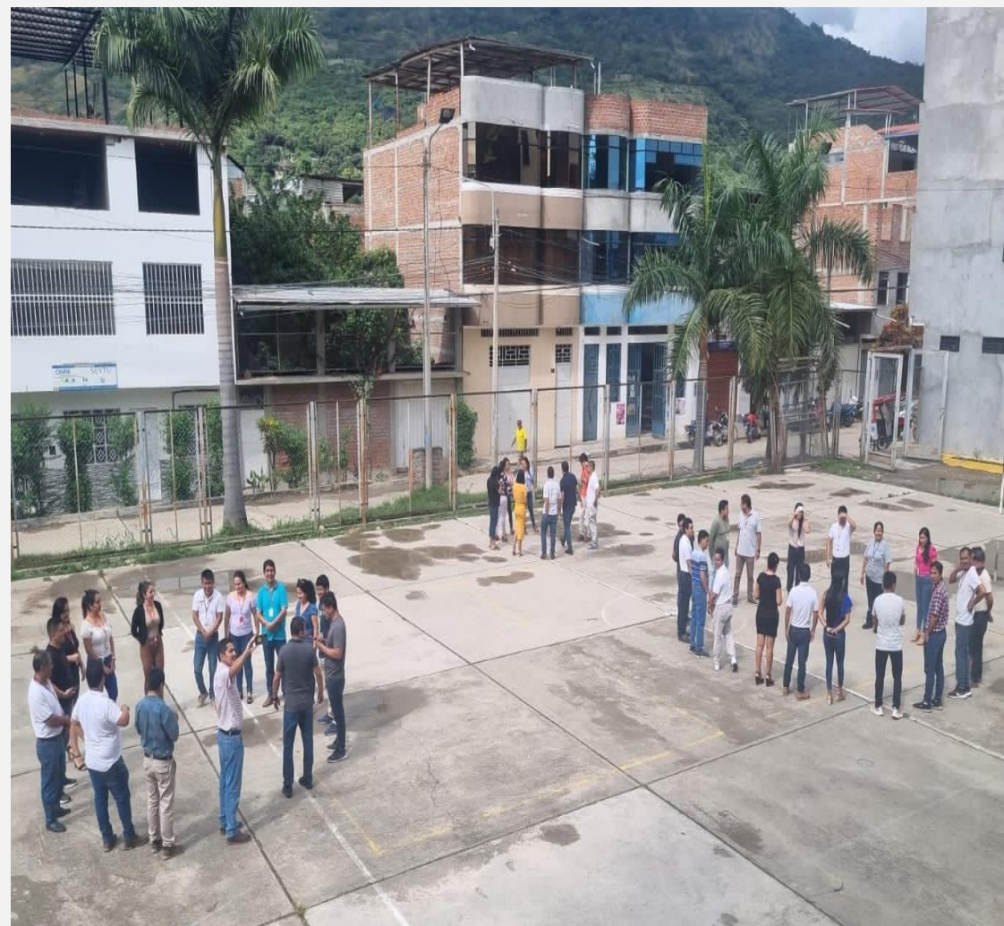
UT Cajamarca 2