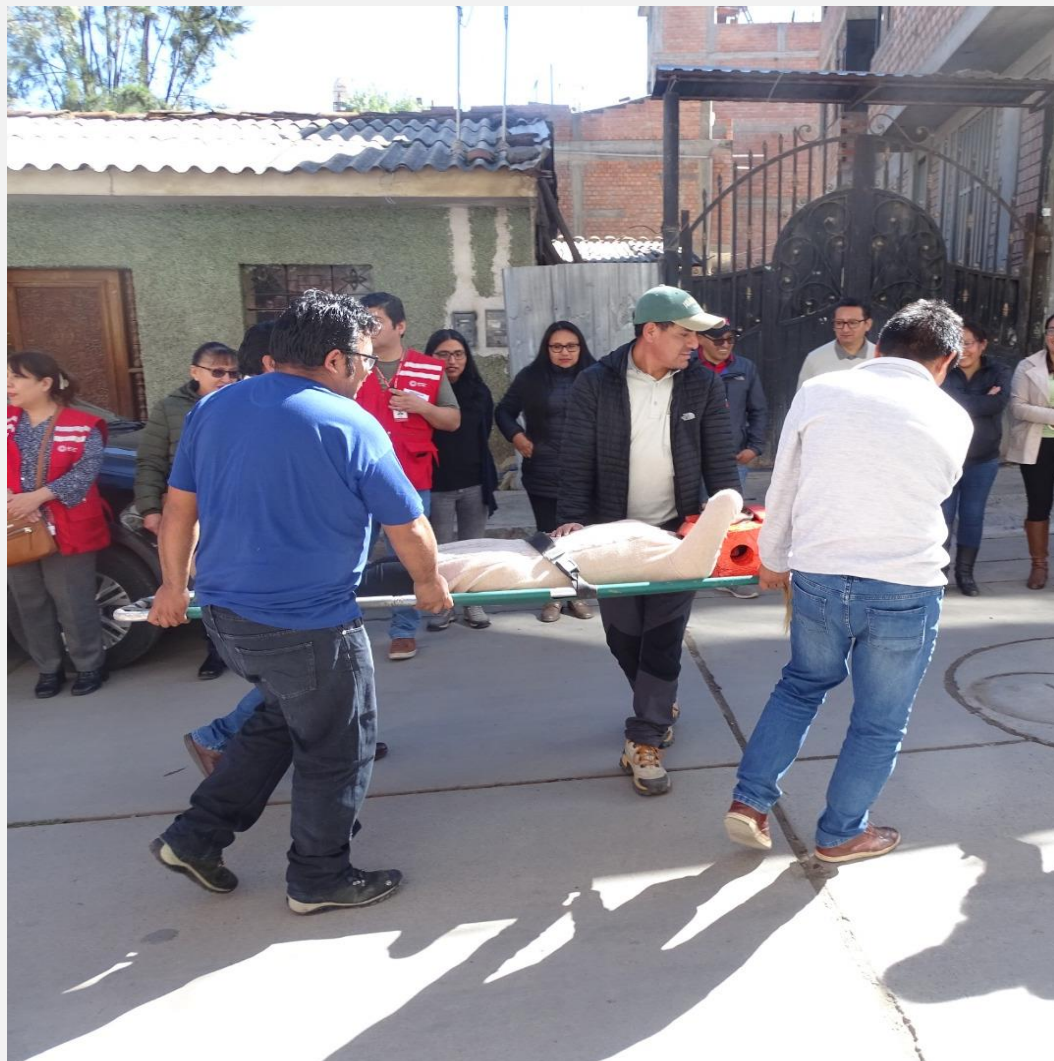
UT Ancash 1