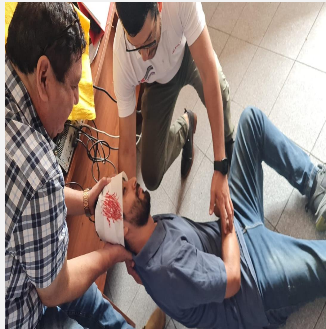
UT Ancash 2