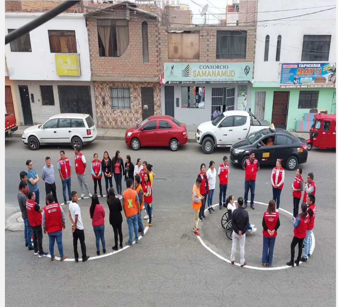
UT Lima Provincias