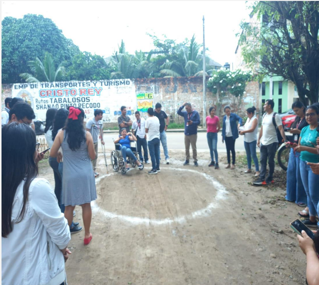
UT San Martín