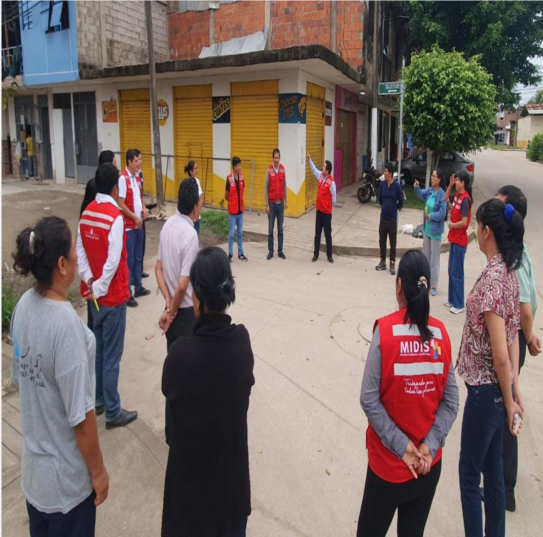
UT Madre de Dios