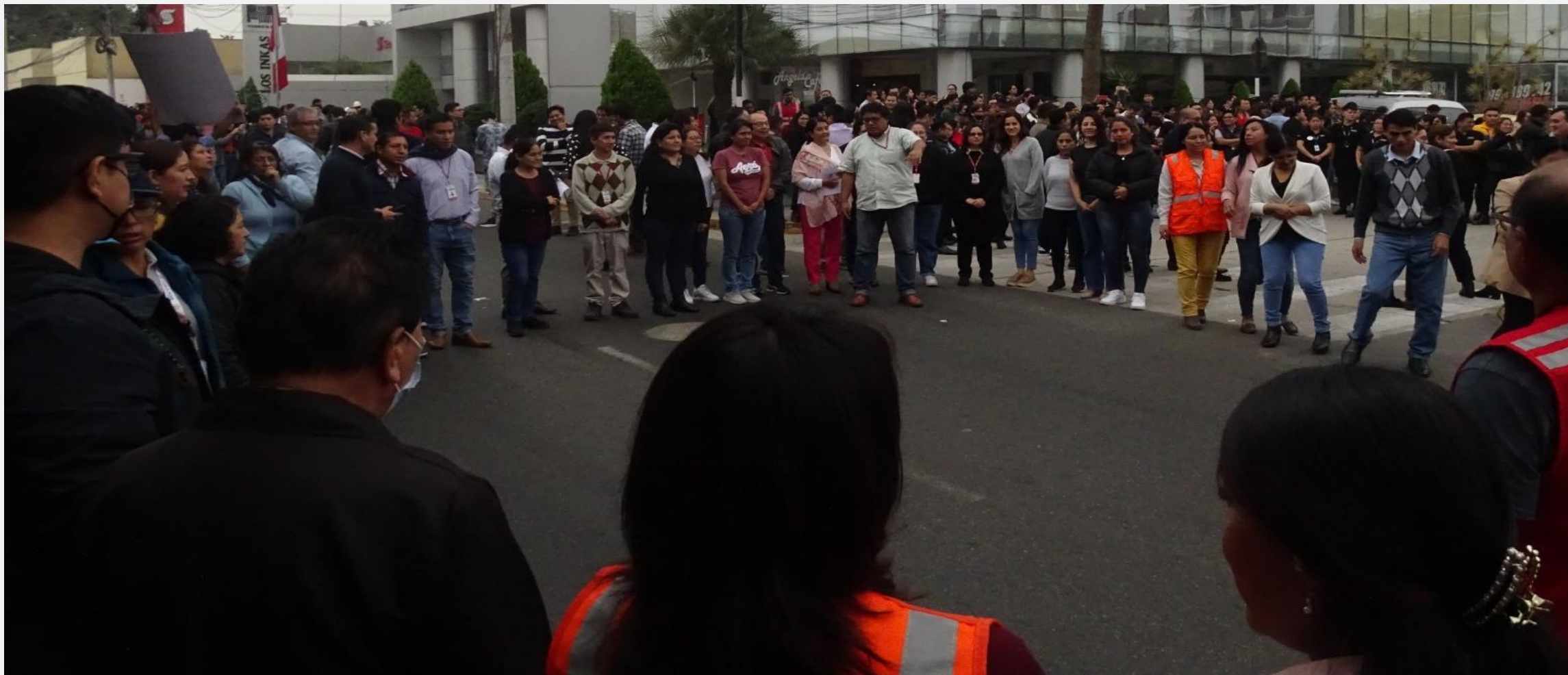
UT Lima Metropolitana y Callao