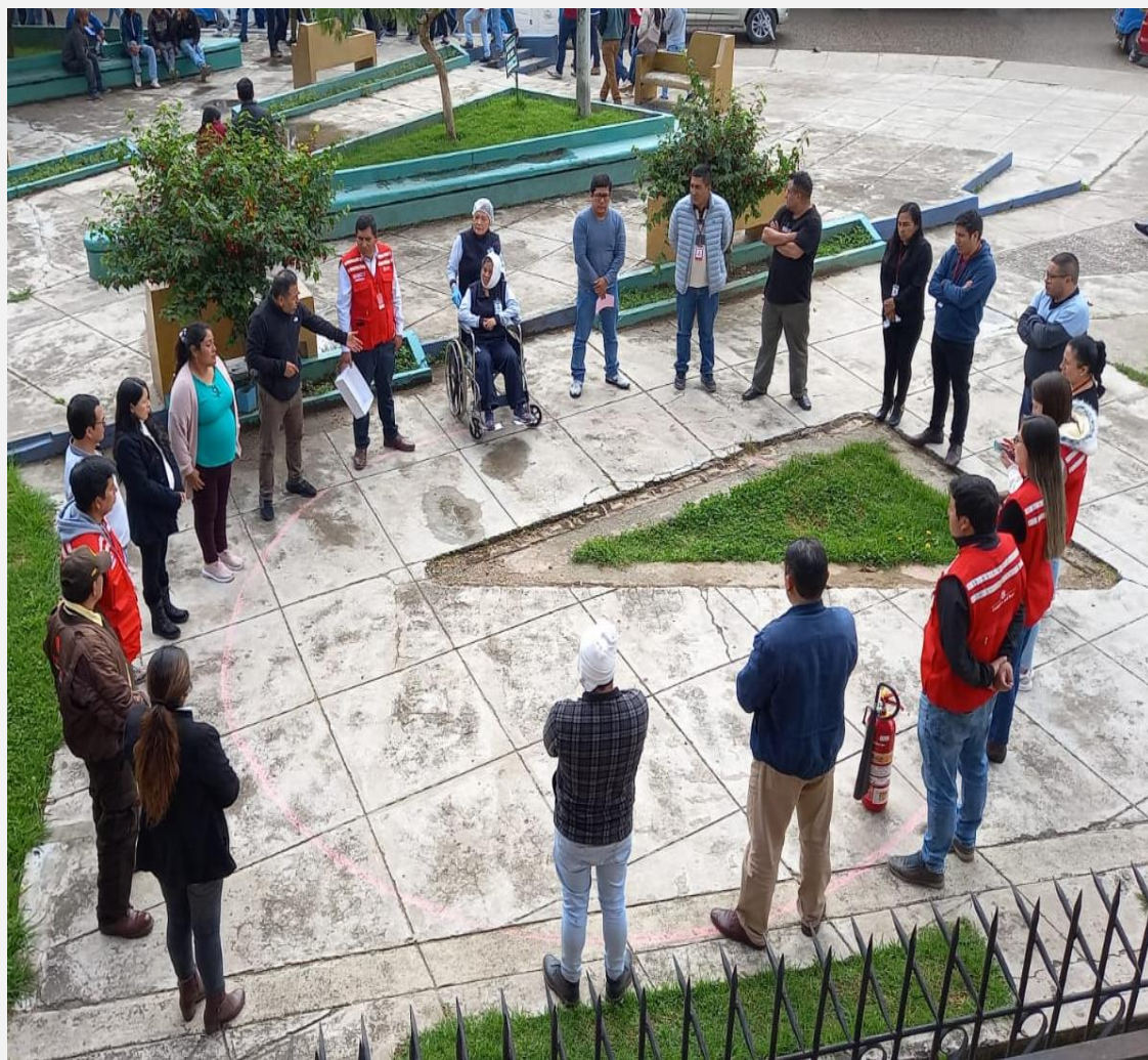
UT Cajamarca 1